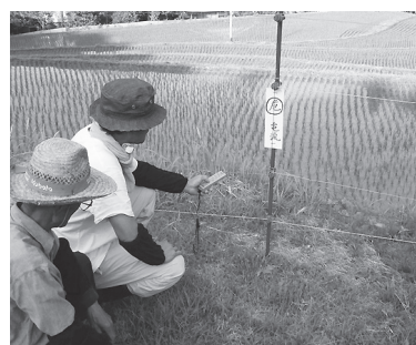
▲見回りをする組合員

ですが、大きなトラブルにつながりかねない設備です。毎日の見回りは欠かせません。漏電を防ぐための草刈等と併せて、組合員が共同して管理しています。近頃はサルを見かけることもあり、その対応も考えなければなりません。毎年の豊作を願って、農地と資材を大切にしながら農業を楽しんでいます。