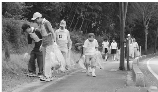
平成20年8月「道路ふれあい月間」道路清掃状況