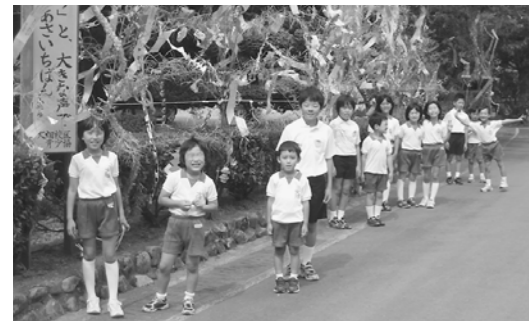
完成した七夕飾りと全校児童

を書いた短冊をつけました。短冊は、合同学習で行った深川小学校のみんなと「螢のふる里まつりIN大畑」に参加された人たちが書いてくれたのを合わせると千枚ぐらいいなりました。 ぼくは、「深川中学校でたくさんの友達ができますように。」と願いました。 まだまだこれからも、たくさん行事があります。大畑小での思い出をいっぱい作りたいです。 平成22年3月19日、大畑小学校最後の卒業式。たった一人の卒業式です。第130号、最後の卒業生、それがぼくです。