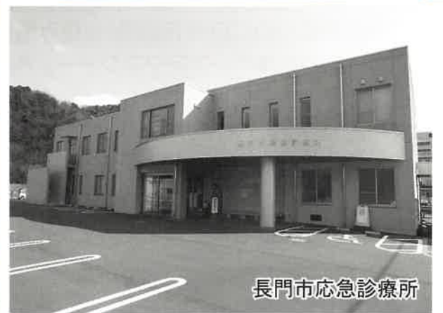
長門市応急診療所