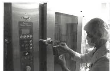
(左から順に筆者による小学校での薬物乱用防止教室、水質検査、学校給食センターでの衛生管理検査)