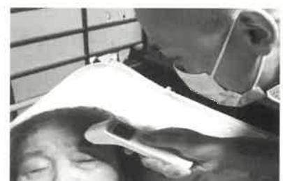
(筆者による居宅療養管理指導。左から順にお薬カレンダーのセット、服薬相談、バイタルサインの測定)