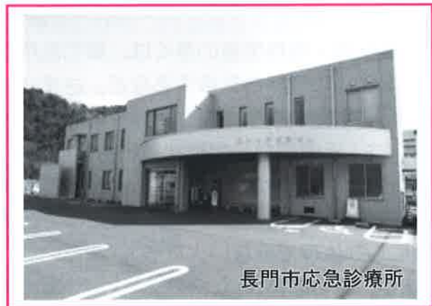
長門市応急診療所

インフルエンザや感染性胃腸炎の予防のために、咳エチケット、手洗い、うがいをしっかり行って、日々の健康管理には十分気をつけましょう。