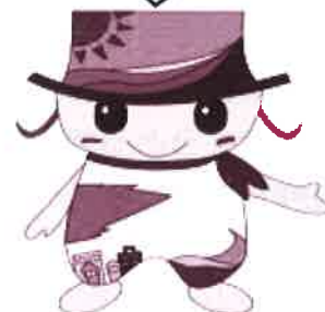
健幸なまち長門イメージキャラクター 「さっちー」