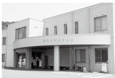
▲夜間や休日でも安心して受診できる