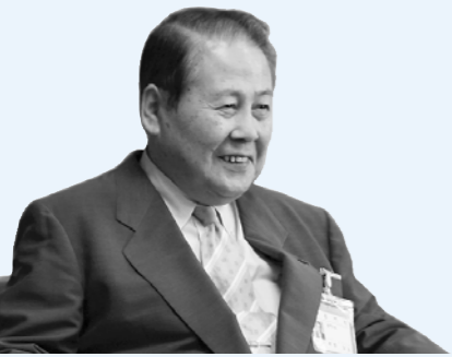
まちづくり懇談会日程表

私自身が皆様方の地域に 出向き、市政についてのご意見やご提言などを直接お聴きし、今後の市政運営に反映させてまいりたいと考えております。 市内7地区に分けて、10月13日から11月6日までの間、順次開催して参りますので、お誘い合わせの上、ぜひご参加くださいますようお願い申し上げます。