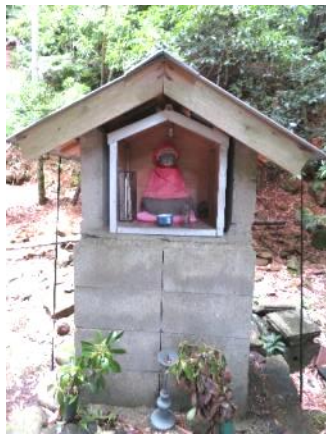
旧米山寺 子安観音菩薩

所在地 深川湯本三ノ瀬 造立年 文久四年(一八六四) 像容 丸彫り座像 左手で赤子抱く 右手施無畏印 像高 三七センチ 台座高 八〇センチ (コンクリートブロック) 刻銘 (尊体背面) 當山三世大寅大和尚建之 施主 国司氏 上下 三瀬村 四瀬村 湯本村 文久四子正月吉日