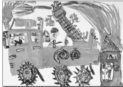
▲ (絵画の部) 梶山大峻/菱海保育園