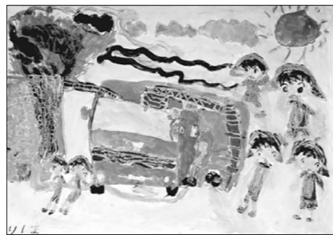
▲ (絵画の部) 村岡莉帆/菱海保育園