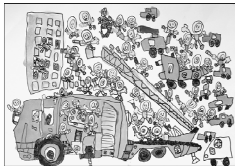
▲ (絵画の部) 近藤橘平/東深川保育園