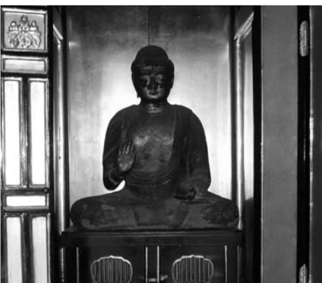
清福寺薬師堂に安置されている薬師如来像

国指定名勝及び天然記念物の青海島は周囲三二キロ、面積一四・六平方キロ。通から青海まで主に外海側の海岸が指定の対象となっている。この海岸は凝灰岩が波の浸食によって出来た磯