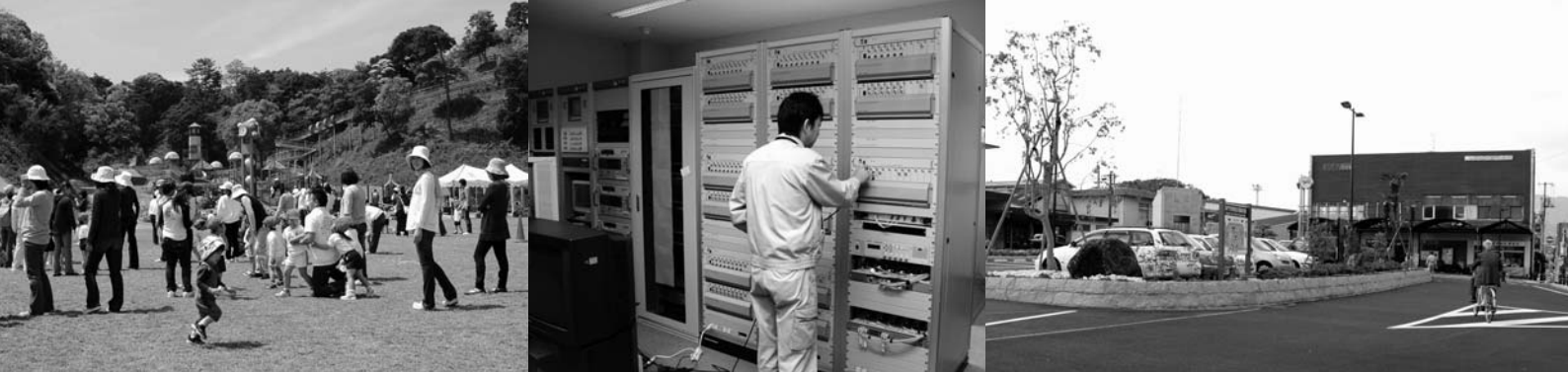
▲完成した長門市総合公園 ▲三隅地域ケーブルテレビ広帯域化が完了 ▲進むまちづくり交付金事業

平成20年3月31日現在における財政状況を公表します。同日現在における予算総額は、一般会計、特別会計を合わせ403億5,214万円で、各会計の予算執行の状況は下記のとおりです。