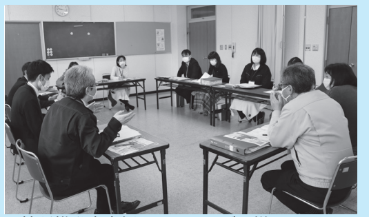
▲接種推進室定例ミーティングの様子

少しお待ちいただくとおと思いますが、接種を希望されるすべての市民の皆さんに接種ができるように、努めてまいります。