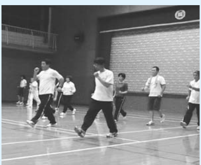
ウォーキング指導を行う体育指導委員