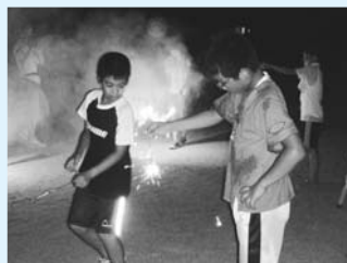
学校キャンプの様子

夕食はそうめん流しとバーベキューでした。そうめん流しの竹は、お父さんたちの力作です。朝早くから山へ竹を切りに行った友だちのお父さんは、大変だったろうなと思いました。流れてくるそうめんの味は格別でした。 消灯になっても、おぼけ屋敷の興奮とみんなと一緒に寝るうれしさが混じって眠れませんでした。 学校キャンプは忘れられない大切な思い出になりました。