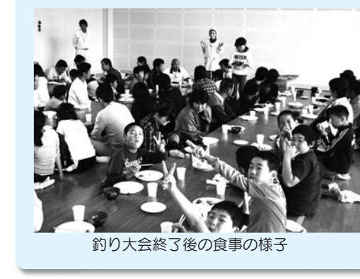
釣り大会終了後の食事の様子

海の子山の子ふれあい体験教室 親子ふれあい魚釣り大会 この事業は、海と山のそれぞれの親子が互いの地域の自然環境や生活環境の特殊性を体験して、地域の特色を知り、親子のふれあいと他地域の家族との交流を深めることを目的に徳山公民館との共催事業として開催しました。