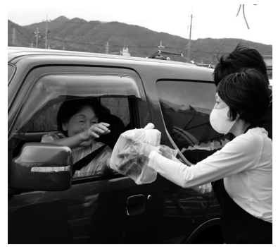
▲お店の味を家でも楽しんでもらう

新型コロナウイルス感染症の影響で安心して外食できない状況が続いているなかで、外食の楽しさを提供できるように「ドライブスルー方式」で地元店の弁当を提供し、長門市の魅力を発信する。