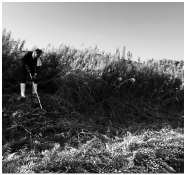
▲荒廃地を整備してラベンダー畑へ

「ハーブを愉しむ日」の開催に向け、ハーブ園周辺の荒廃地をラベンダー畑として楽しめる空間に再生する。