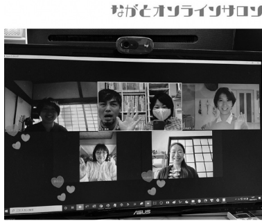
▲学びと飲食店の支援を両立

市内飲食店が提供するテイクアウト商品を食べながら、キャッチレス決済や異業種交流、管理栄養士による食を通じた健康について学ぶ機会を提供する。