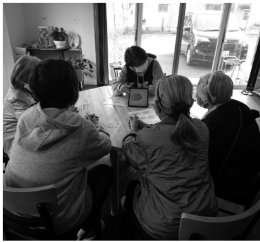
▲健康チェックの結果を説明

いつまでも住み慣れた地域で元気で過ごすことを目的に「通いの場」を設置し、高齢者だけでなく、誰もが利用し、自分の健康を振り返り、健康意識を持つきっかけとなる場とする。