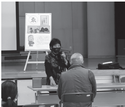
▲ゆや歴史かるた大会

令和2年度採択事例の紹介 《課題提示型》 市が提示する課題「健康寿命の延伸に向けた事業」に沿った事業への支援 ゆや地区高齢者・障がい者健康づくり推進事業 PART III ■実施団体 ゆや地区社会福祉協議会 ■内容 予防の視点をもって健康に生