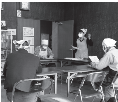
▲高齢者の料理づくり教室

市民参画による地域づくりを進めていくために、平成26年度から「市民のちから応援補助金」の交付を行っています。令和元年度までに延べ56団体、1,668万5千円の交付を行っており、多くの市民活動団体の育成と活性化を図っています。 この取組を進め、協働によるまちづくりの環境整備を行い、「ひとが輝き、やさしさがこだまするまち 長門」の実現を目指します。