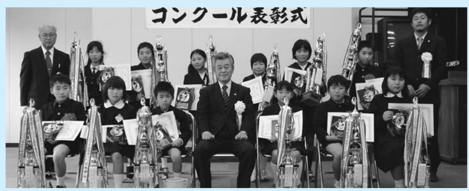
コンクール表彰式