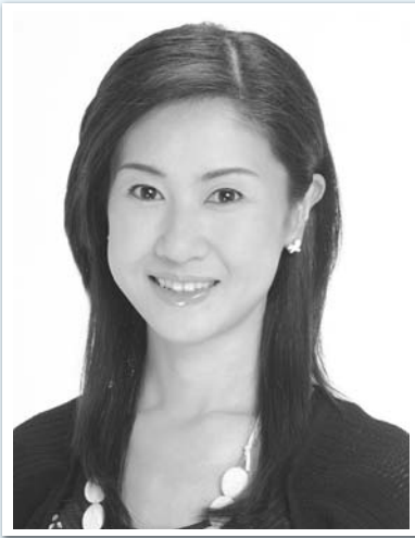
小林綾子さんプロフィール 平成7年、NHKスペシャル「こころの王国 童謡詩人金子みすゞの世界」に金子みすゞ役で出演。平成12年に第8回仙崎みすゞまつり・金子みすゞメモリアルコンサート「みすゞ故郷に帰る」で来市。CD「朗読と歌 金子みすゞの詩」を発売中。その他県内でロケを行った映画「四日間の奇蹟」「ヘレンケラーを知っていますか」に出演。NHKドラマ「おしん」のおしん役で日本のみならず海外でも人気。

このたび長門市では、童謡詩人金子みすゞの心を広く全国に伝え、かつ、市のイメージの高揚と文化・観光の振興を図るため、「みすゞふるさと大使」を設置し、女優の小林綾子さんに大使を委嘱することになりました。小林さんは、平成7年にNHKスペシャル「こころの王国 童謡詩人金子みすゞ」で金子みすゞ役を演じてから、金子みすゞへの思いを強くし、各地で金子みすゞの詩の朗読を行うなど、みすゞの心を広く全国に伝えることをご自身のライフワークとして取り組まれています。 今後は「みすゞふるさと大使」として、金子みすゞの心を広く全国に伝えるとともに、長門市のイメージアップや観光の振興に向けたPR活動を様々な場所で行っていただきます。皆さんの応援をよろしくお願いいたします。 また、大使の委嘱にあたり次のお通り委嘱状交付式およびトークショーを開催します。ぜひご来場ください。