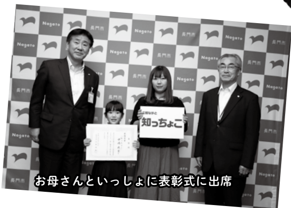
お母さんと一緒に表彰式に出席