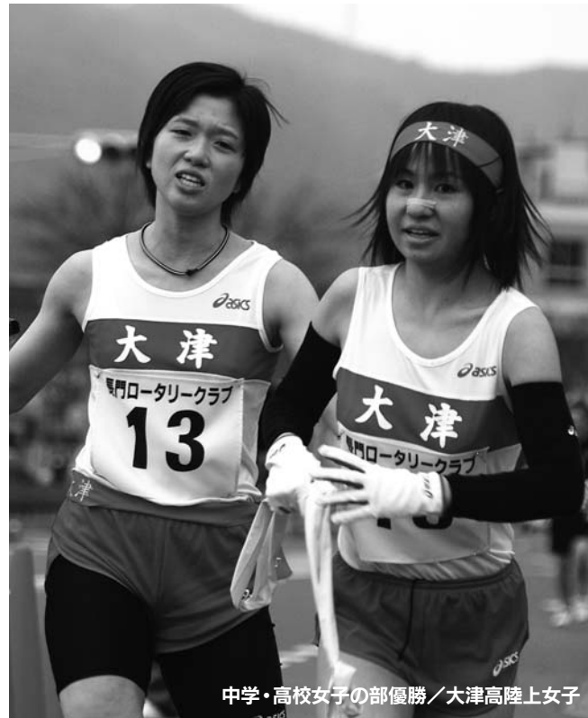
中学・高校女子の部優勝／大津高陸上女子