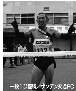
一般1部優勝／サンデン交通RC