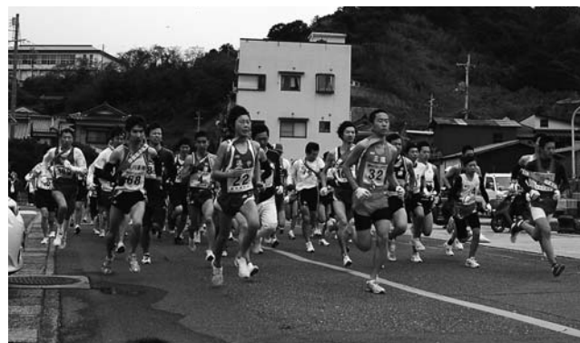
▲男子、中学・高校女子の部スタート