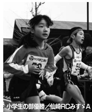
小学生の部優勝／仙崎RCみすゞA