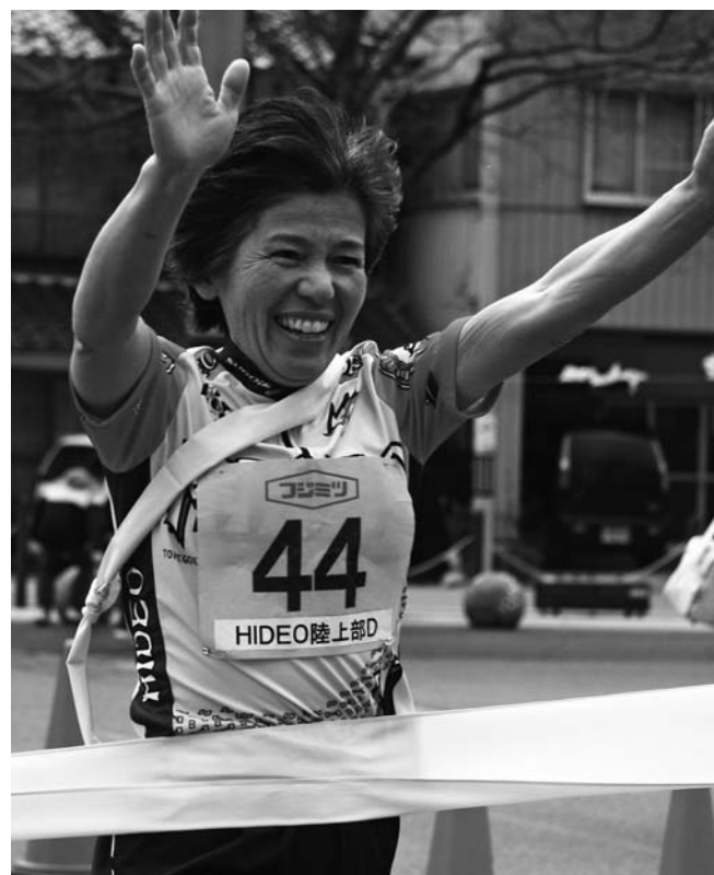
▲一般女子の部優勝／HIDEO陸上部D

この日は時折小雪の舞うあいにくの天候でしたが、選手たちは沿道に駆けつけた市民からの大きな声援を背に、6区間20・53km(小学生・一般女子は10・22km)のコースを力走。タスキをつなぎました。10・22kmの部は、「仙崎RCみすゞA」が、また20・53kmの部は、「大津高校陸上長距離」が総合優勝を飾りました。長門市中央公民館で行われた閉会式では、各部門の上位3チームと区間賞受賞者が表彰されました。