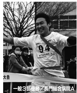
一般3部優勝／長門総合病院A