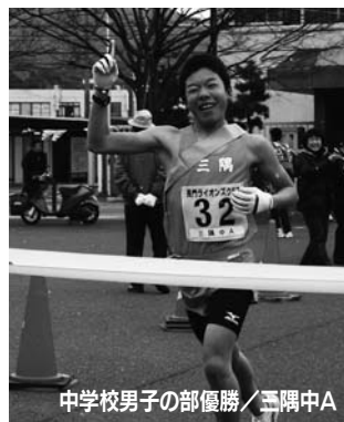
中学校男子の部優勝／三隅中A