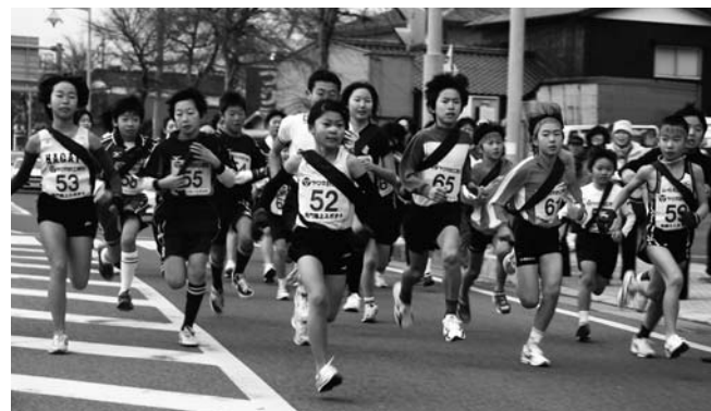
▲小学生・一般女子の部スタート