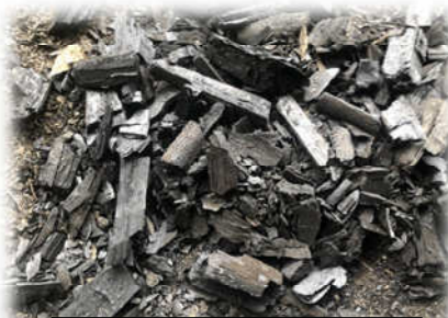
実際に出来上がった炭

今後の予定としては炭窯自体の改良と質の高い炭ができるかどうかの検証を行っていきます。