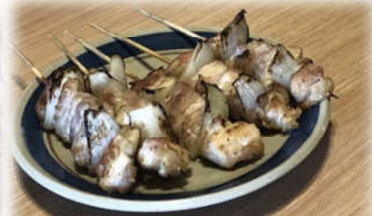
出来上がった炭で焼いた焼き鳥 (ちくぜん総本店にて)