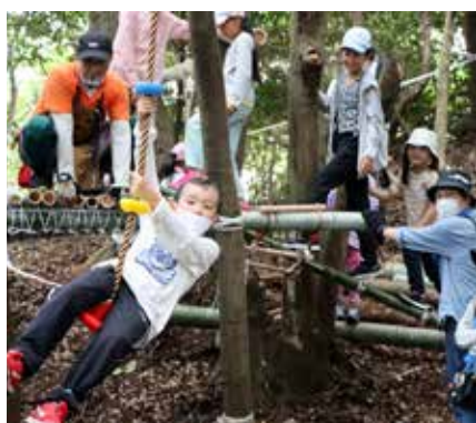
▲イベント終了後は解体されたとのこと

この日は、深川小学校の児童30人とその保護者らが参加。はじめに、注意事項が説明されると、子どもたちは自分たちでなにを作るかを話し合い、協力してブランコやスラックラインなどをつくり、その後、自分たちが作った遊び場を楽しそうに遊んでいました。