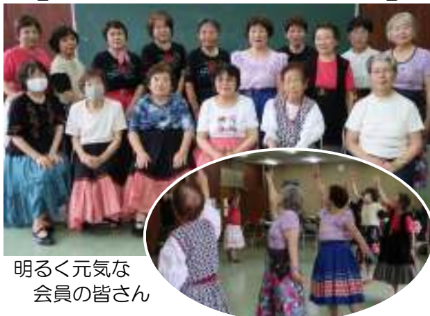
明るく元気な 会員の皆さん

第1・3金曜日午後1時30分から3時30分 まで改善センターにて活動しています。フォーク ダンスとは民俗舞踊のこと。その昔、狩りの収穫 を祝って踊ることから始まったといわれています。 大勢で踊ることによって連帯感を養い、誰にでも踊 れて楽しむことができるのがフォークダンスの 魅力です。「ストレッチをした後、『また君に恋し てる』などの曲に合わせてみんなで楽しく踊って います。全身運動で脳トレにもなりますよ。健康 維持のために一緒に踊ってみませんか？興味のある方は是非見学に来てください。（代表：岡村）」