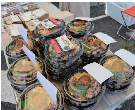
▲お店の情報はSNSで発信されています

5月7日(木)は、5店舗7商品が並び、10時すぎから次々と弁当を購入するお客さんと賑わい、昼すぎには完売。「長門市民助け合い応援券」を利用し、弁当を購入する光景も見られました。