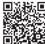
▲市ホームページ (上級)