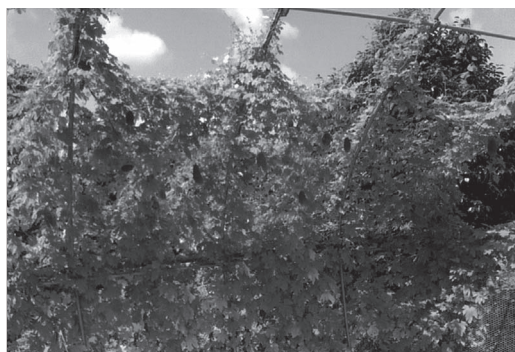
▲「令和元年度緑のカーテンコンテスト」最優秀賞

■問い合わせ 6／21（日）～7／7（火）生活環境課環境衛生係 TEL 23・1134