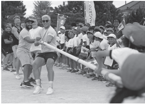
▲昨年度のカナダチームとの交流の様子