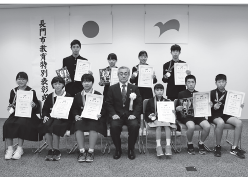
▲表彰式(メダル・楯表彰のみ)