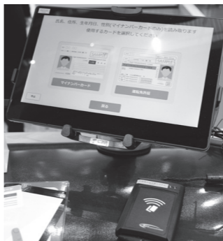
▲端末から簡単に申請ができます

できます。この場合、免許証の第一暗証番号(4桁)が必要です。手順はマイナンバーカードの場合とほぼ同じです ■複数の申請書でも 申請書は複数の種類をまとめて選ぶことができます。それぞれ申請書に記入日、住所、氏名などの項目を印字して出力されます ■注意点 処理にはマイナンバーカードや免許証のICチップ内の情報を使用します。このため、内容が未更新の場合、以前の情報が出力されますので、注意が必要です ■問い合わせ 総合窓口課窓口係 Tel 23・1128