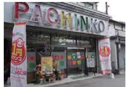
景観に与える影響が大きい ぱちんこ店等を規制

景観協定では、自己敷地外の看板の規制、電球色の灯りによる演出の推進を目指しています。また、景観に与える影響の大きい、遊技場営業（風適法4号営業）のまあじゃん屋、ぱちんこ屋について景観協定で規制を検討します。合わせてこれまで議論のあった、湯本の一部地域で規制対象外となっているストリップ劇場等の性風俗用途の規制についても引き続き検討していきます。