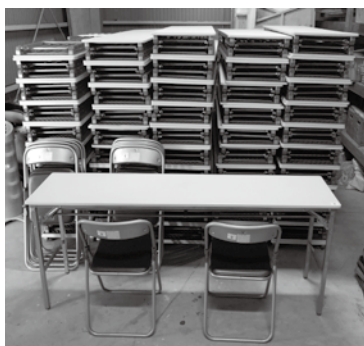
▲新たに整備された備品