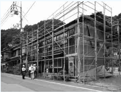
▲年度内のオープンを目指す長屋プロジェクト

長門湯本温泉では、リノベーションがうまく進むよう、専門家を含めたサポート体制を整えた上で事業を進めており、物件所有者が「まちのためなら」と思っていただけのような話し合いも行っています。まちの魅力が向上する要素を考える中、「おとずれリノベ」によってこれまでになく魅力やアイデアが生まれつつあります。