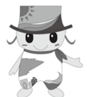
▲生涯「健幸」なまちながとイメージキャラクター さっちー