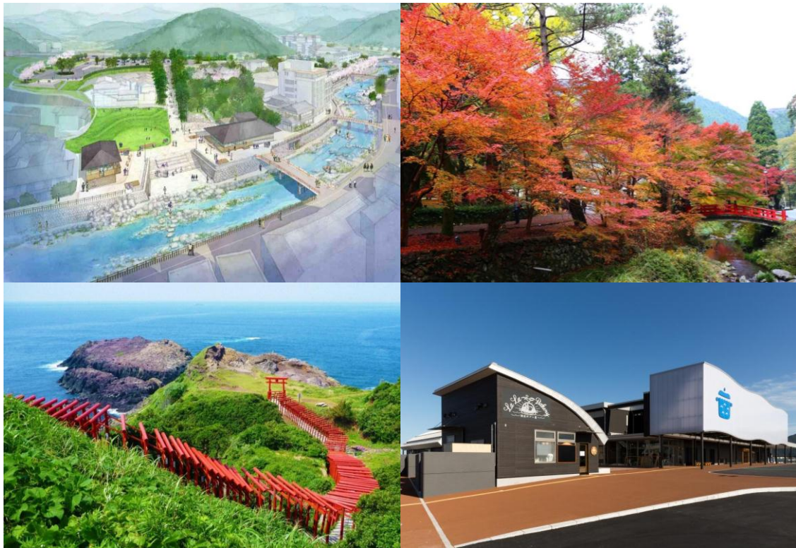
長門市の主な観光スポット(左上：長門湯本温泉、左下：元乃隅神社、右上：大寧寺、右下：道の駅センザキッチン)

具体的には、観光庁補助金(観光地の「まちあるき」の満足度向上整備支援事業)を活用し、長門市内の主要な観光地や交通要所に無料で利用可能なWi-Fi環境を整備することで、国内外からの観光客をはじめとした来訪者に対して情報通信手段の利便性向上を図るとともに、位置情報に基づき適切な観光・イベント情報などを発信します。さらに、Wi-Fi環境から収集したデータを利活用することで、さらなる長門市への集客力の向上および周遊観光の強化を図り、観光振興による地域活性化に取り組みます。