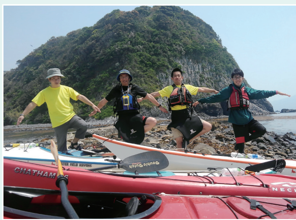
▲ボニーベイシーカヤックセンターを拠点に活動中

「よく働き、よく遊ぶ」をモットーに、休日には時間の取れるメンバーで集まり、「釣り」「シーカヤック」「キャンプ」「BBQ」など、様々なアウトドア活動を通じて長門市の自然を満喫しています。また、「シーカヤック」では、シーカヤックフェスティバルを開催するほか、インストラクター資格を持った4名が市内の中学生や観光客等への体験指導を行うなど、趣味を活かした長門の魅力向上への取組を行っています。