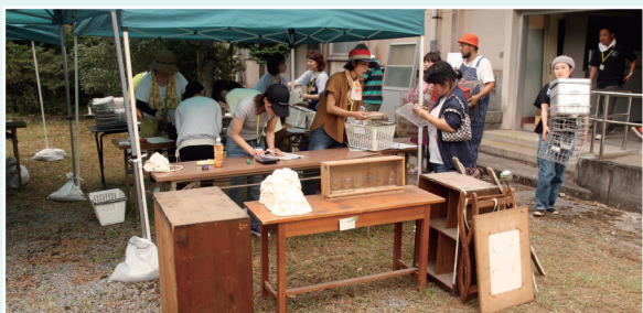
▲学校備品販売会を開催し、多くの来場者を迎えた

長門市役所では、自分の担当業務以外でも、興味のある分野について自主的な勉強や研究に取り組める「自主研究グループ制度」があり、この制度を活用して自分のやりたいことにチャレンジしています。