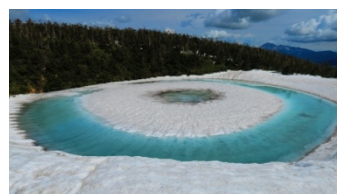
八幡平ドラゴンアイ