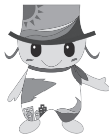
▲生涯「健幸」なまちながとイメージキャラクター「さっちー」

酸素運動であるため、エネルギーを効率的に消費します。市では、定期的なウォーキング教室を開催しています。また、普及サポーターの養成や健康づくりグループを支援します。