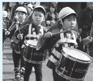
▲俵山幼児園防火パレード。火の用心！

一人ひとりが森林の大切さを認識し、次のことにしっかりと注意して林野火災防止に努めましょう。