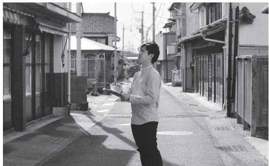
▲日置地区をくまなく歩きながら、空き家調査を行う

活動中の古民家活用経験やたくさんの方との交流経験を活かして、退任後にはリノベーション事業などに従事していければと考えています。どうぞよろしくお願ひします。