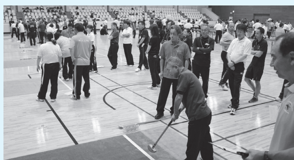
▲白熱するバター・de・ピンゴ。誰でもすぐプレーできる

皆さんは、長門市スポーツ推進委員考案のニユースポーツ「バター・de・ピンゴ」をご存知でしょうか。子どもから高齢者まで、気軽に楽しむことができます。今年から深川スポーツ振興会で、初めての大会が企画されます。他の