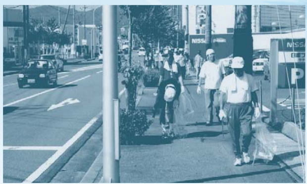
平成16年8月7日「道の日」道路清掃状況