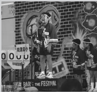
昨年の第3回大会の様子