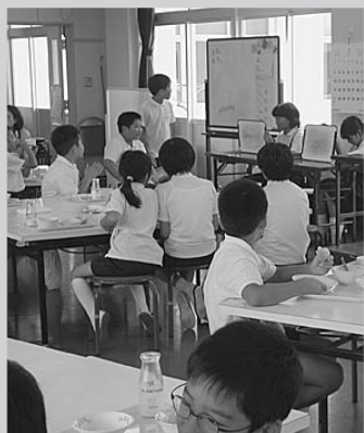
みんなで楽しく「二人でドン」

難しいけれど、そこがまたおもしろいのです。時には、先生方も参加されます。先生方に勝つと、うれしさも倍増します。試食会の時、お母さんたちとの対決も、これまで以上に盛り上がりました。