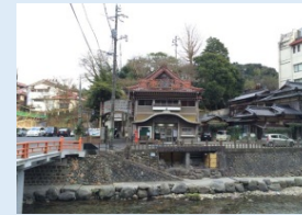
恩湯 温泉湧出の原点で元湯であり、湯本温泉のシンボル。