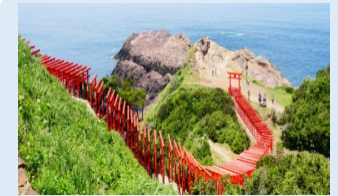
元乃隅稻成神社 100m以上に渡り123機の鳥居が並ぶ。約6mの大鳥居の上部にある賽銭箱に賽銭が入れば願いが叶うと言われている。