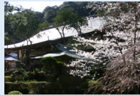
大寧寺 西の高野と言われ、1410年当時の守護代、鷲頭弘忠創建と伝わる曹洞宗屈指の名刹。