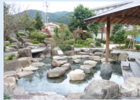
音信川河川公園 音信川と大寧寺川の合流地点にある足湯が魅力の公園。