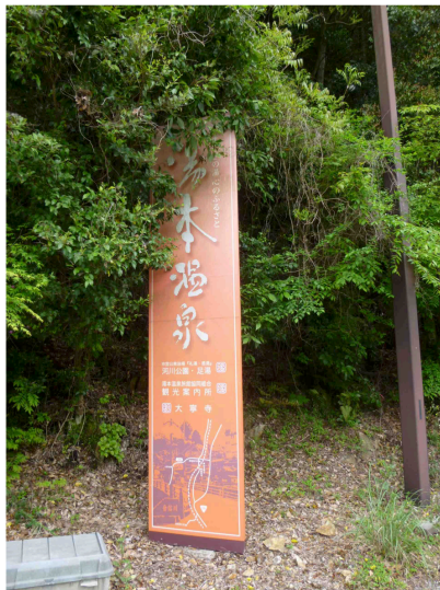
オレンジサイン3／大寧寺出入口