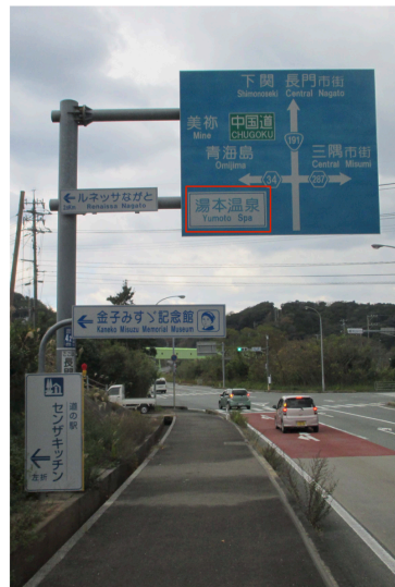
D3) 国道191号・仙崎交差点付近