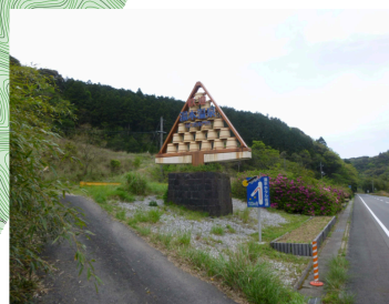
桶オブジェ①: 国道316号・美祢方面