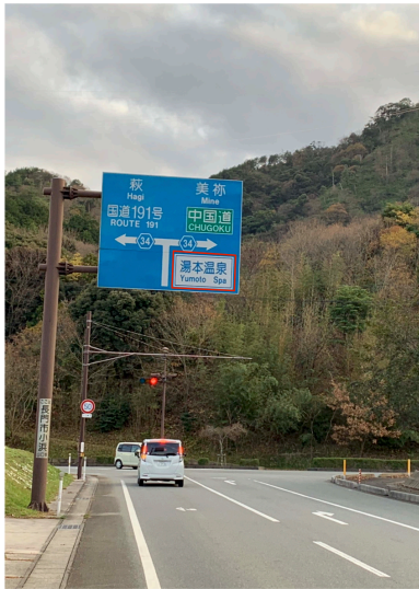
E3) 県道282号線 県道34号線との交差点手前