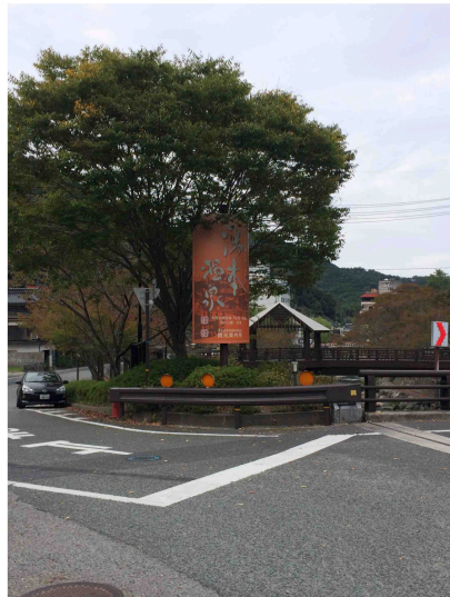
オレンジサイン2／音信大橋南側