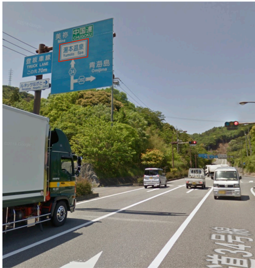
E2) 県道34号線・県道282号線との交差点付近