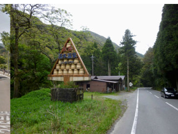
桶オブジェ③: 県道34号線・俵山方面