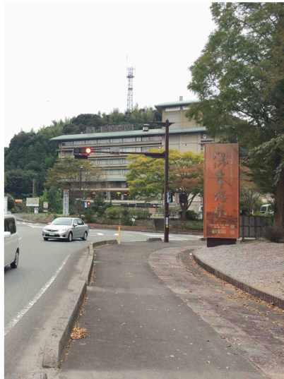
オレンジサイン1／湯本交差点 (3面表示)