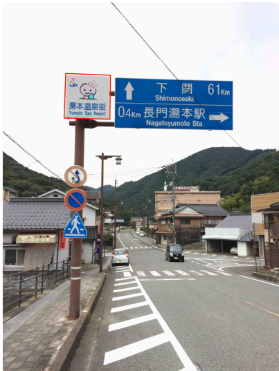
湯本大橋西側 (俵山方面の標識)