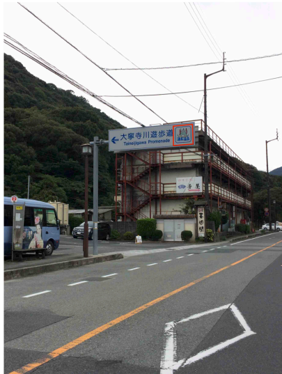
玉泉閣入口付近 (俵山方面の標識／両面に表示有り)