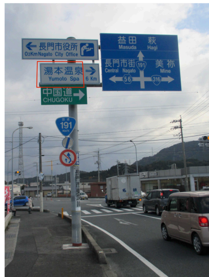
D1) 国道191号・正明市交差点 南