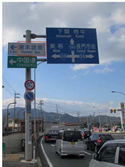
D2) 国道191号・正明市交差点 北