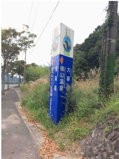
青白サイン／湯本交差点