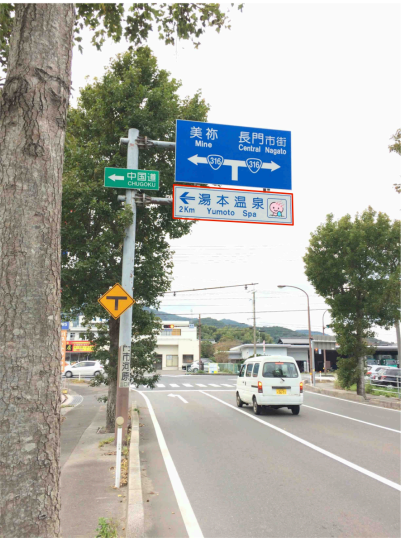
E1) 県道34号線・板持交差点付近