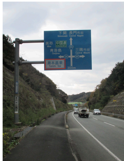
D4) 国道191号・三隅下付近