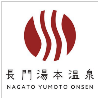
1200×1200（形状寸法・要確認）