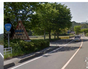
桶オブジェ②: 国道316号・長門方面 (google map street view)