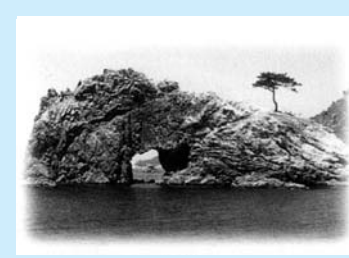
▲ みす×仙崎八景「花津浦」