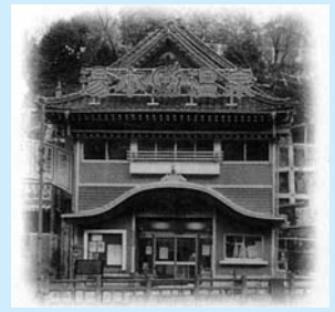
▲ 長門温泉郷五名湯「湯本温泉」