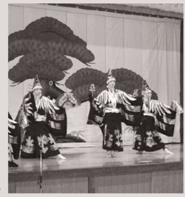
俵山地区文化産業祭での初舞台

歌舞伎には、まったく興味がなかった僕。そんな僕に歌舞伎の楽しさや奥深さを教えてくださったのは、講師の藤間(伊藤)先生でした。 僕たちが藤間先生から教わったのは、「三番叟」という慶びの舞いです。3年生17人と学校の先生3人で4つの組(5人1組)を作り、練習が始まりました。 最初は、藤間先生の動きにまったくついていけず、いやいや踊っている自分がいました。しかし、藤間先生の熱意と友だちの頑張り、少しずつ僕を変えてくれました。 「早く踊れるようになりたい」、「もう少しうまくなりたい」という気持ち、僕の心の中に芽生えてきたのです。