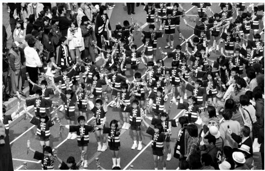
▲幼稚園児・保育園児約200人参加による「幼年消防クラブパレード」