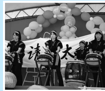
▲勇ましい清風太鼓ライブ