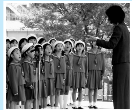
▲みず×少年少女合唱団による合唄