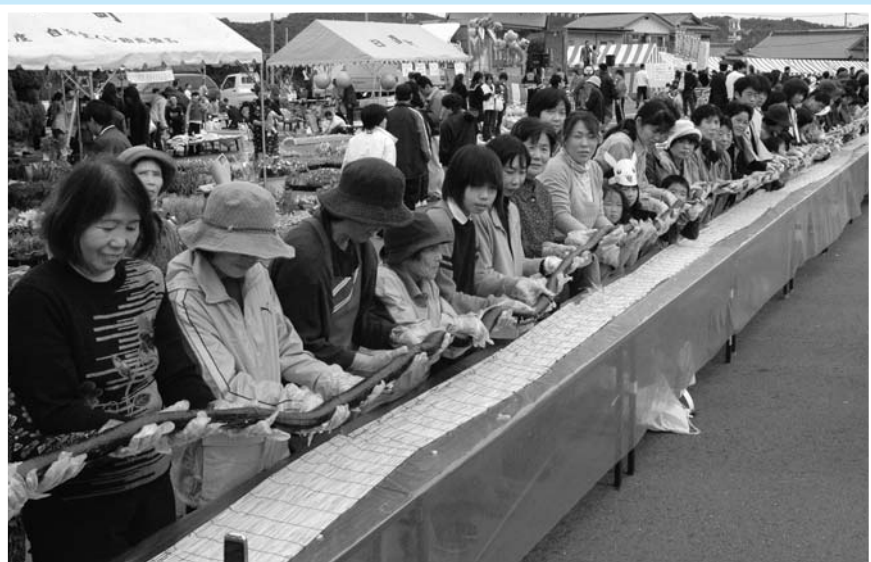
▲ 米60kgと海苔534枚を使った74mの「ジャンボのり巻き」