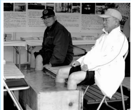
▲のんびりリラックス/足湯体験コーナー

三隅公民館周辺で開催された「みすみふるさとまつり」みんなのカーニバル2005。今年「風船・新たな出会い」をキーワードに4千個の風船を大空へ飛ばすなど風船を使ったイベントや飾りが企画されました。 恒例となった「カーニバルキングコンテスト」には10チームが参加し、様々な趣向を凝らした仮装や踊りを披露。訪れた観客も各チームのパフォーマンスを大いに楽しみました。