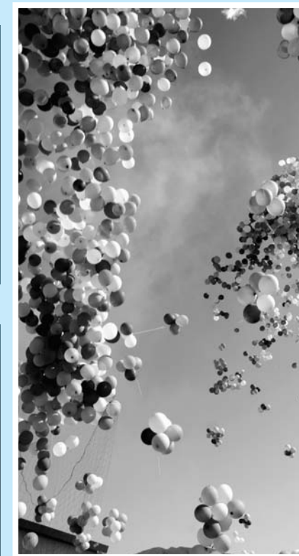
▲大空を舞う4千個の風船パレード