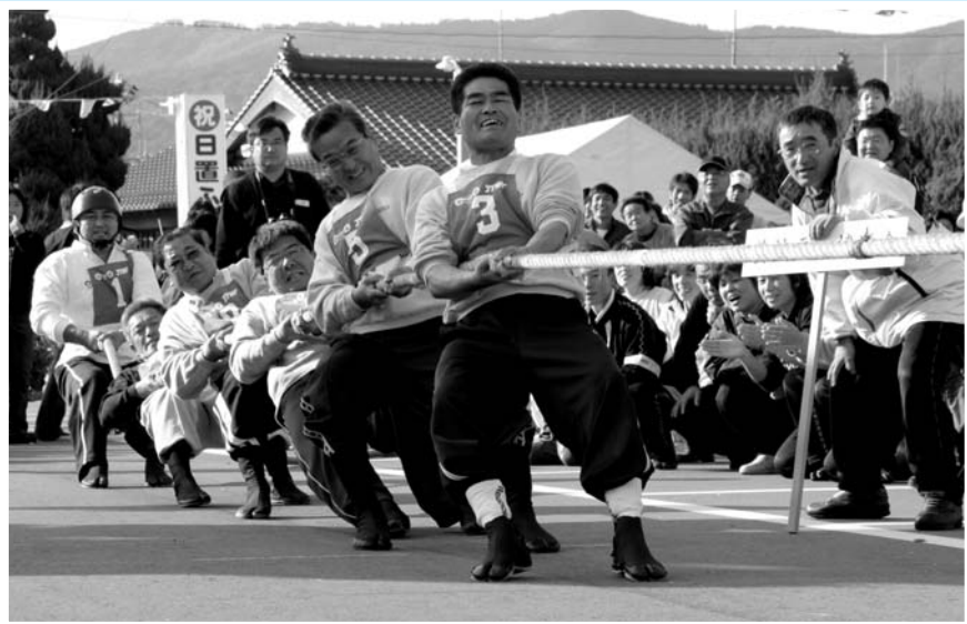
▲ 綱引き大会・一般男子決勝戦で劇的勝利を取めた黄波戸口健進会

日置農村環境改善センターなどを会場に「日置ふるさとまつり」が開催されました。恒例となったジャンボのり巻き作りには約150人が参加。今年は74mののり巻き作りに挑戦し、見事成功しました。ステージでは九州を拠点に活動するヤドカリのライブや地元太鼓グループの演奏が行われたほか、地元自治会等が参加した綱引き大会も行われ、観客から大きな声援が送られていました。