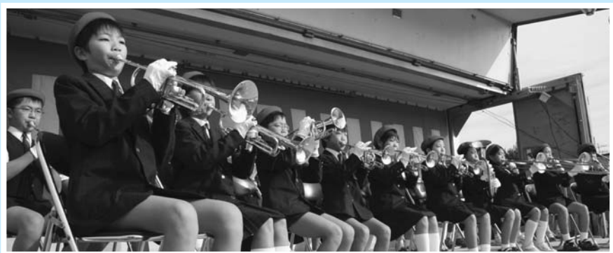
▲ 日置小学校児童による金管バンド演奏