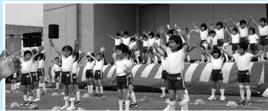
▲ 元気いっぱい油谷地区の保育園児のダンス