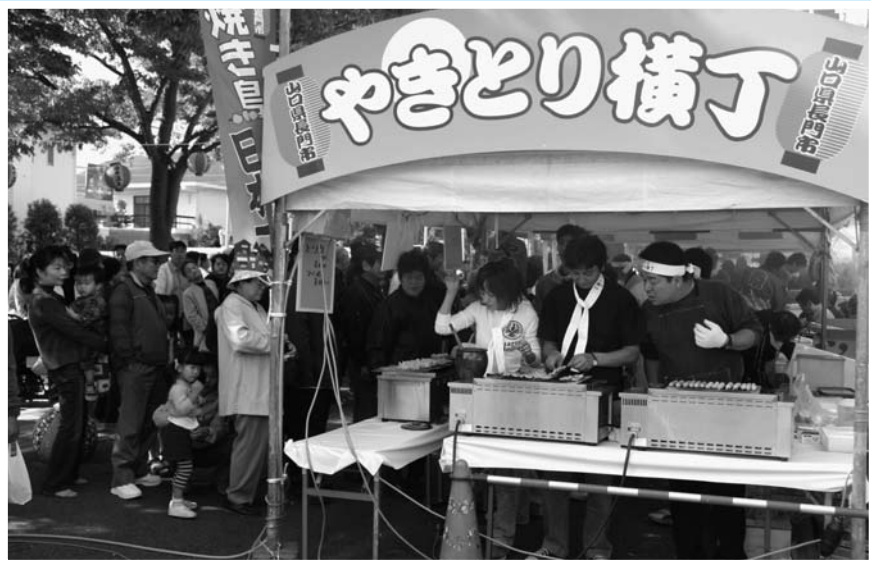
▲市内の焼き鳥専門店が軒を連ねた「やきとり横丁」、長〜い行列ができました

市役所本庁周辺で「第21回いきのびのびながとふるさとまつり」が開催され、約4万人の人数で賑わいました。 市内の焼き鳥専門店6店が軒を並べた「やきとり横丁」には専門店の味を食べ比べようと、午前中から長い列ができました。 また、市内の5団体が競演した「長門和太鼓コンサート」や「長門温泉郷五名湯・足湯体験コーナー」もあり、訪れた人々は秋晴れの日を楽しんでいました。