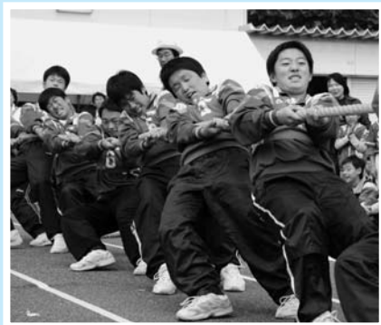
▲見ている方にも力が入る! / 綱引き