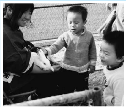
▲ わ〜い！ウサギだあ／ワクワク動物広場