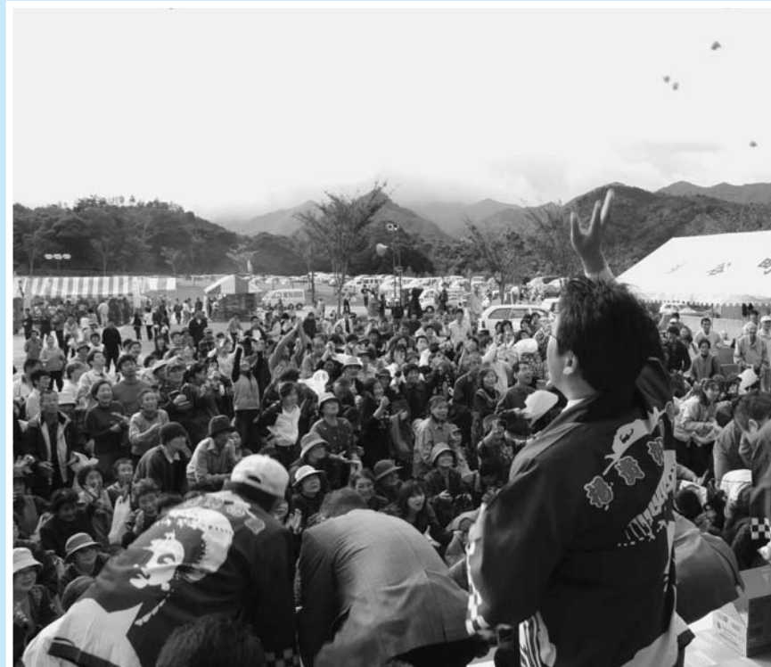
▲ 2回行われたもちまきはどちらも大盛況！みなさんいくつ持ち帰られましたか？

ラポールゆや駐車場を会場に「ふれあいふるさとまつりinゆや」が開催され、小雨の中、多くの人が賑わいました。メインステージではカラオケ大会や郷土芸能発表などが行われ、カラオケ大会には9組の歌自慢が出場。ステージで堂々と熱唱する姿に会場からは大きな拍手が送られていました。また、午前と午後の2回行われたもちまきには大勢の人が詰めかけ、会場が大いに活気づきました。