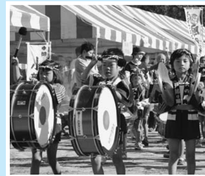
▲三隅保育園児による鼓笛隊