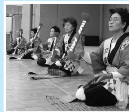
▲ 健康いきいき／銭太鼓演奏