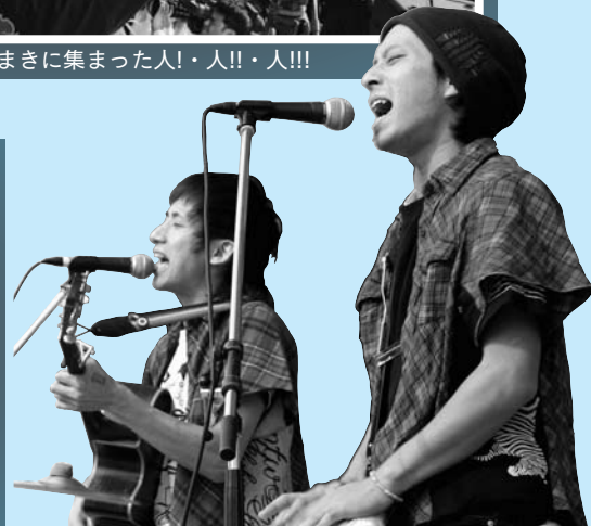
▲ 人気バンド「ヤドカリ」ライブ

ラポールゆや駐車場を会場に「ふれあいふるさとまつりinゆや」が開催され、小雨の中、多くの人が賑わいました。メインステージではカラオケ大会や郷土芸能発表などが行われ、カラオケ大会には9組の歌自慢が出場。ステージで堂々と熱唱する姿に会場からは大きな拍手が送られていました。また、午前と午後の2回行われたもちまきには大勢の人が詰めかけ、会場が大いに活気づきました。