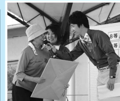
▲抽選に当たったご感想は?