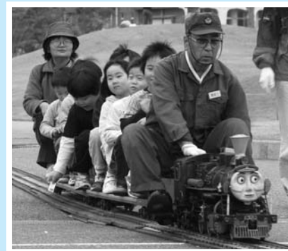
▲ 出発進行〜！大人気のミニSL乗車会