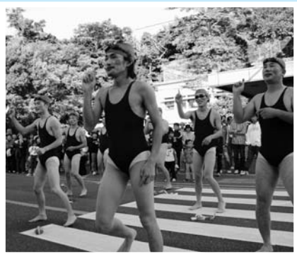
▲ウォーターボーイズ再び!! / シャギリ