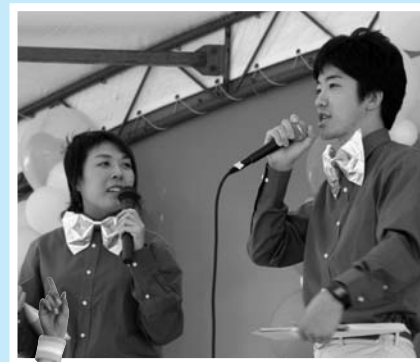
▲息のあった司会ぶりを見せた2人