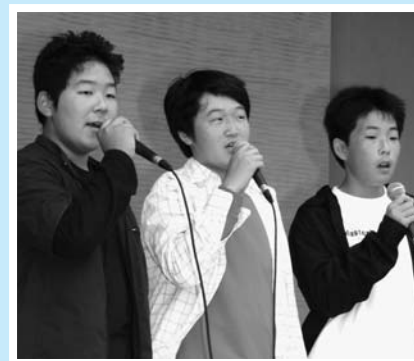
▲ 3人で歌いました／カラオケ大会