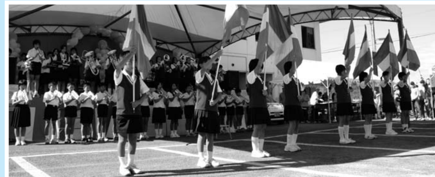
▲一糸乱れない旗さき/明倫小学校児童によるマーチングバンド