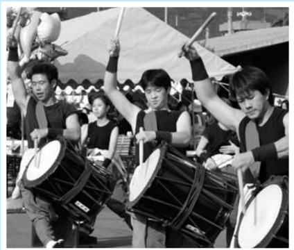
▲ 鼓波会による迫力ある演奏