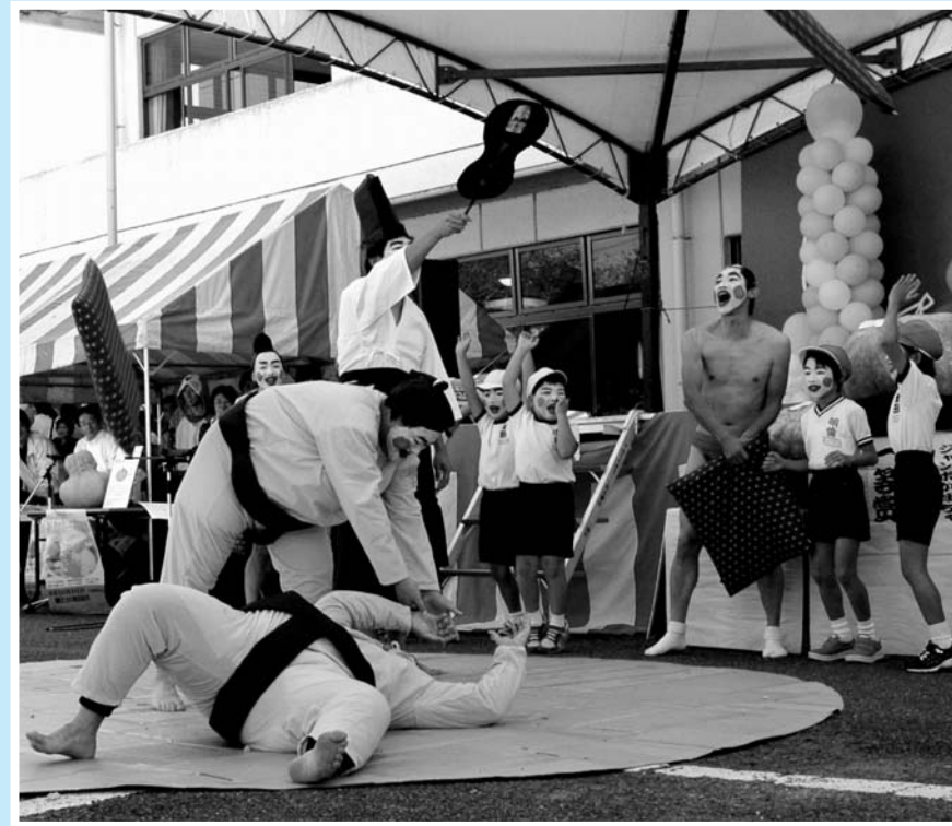
▲見事な投げでカーニバルキングコンテスト3連覇を達成した「2年どんぐり組」

三隅公民館周辺で開催された「みすみふるさとまつり」みんなのカーニバル2005。今年「風船・新たな出会い」をキーワードに4千個の風船を大空へ飛ばすなど風船を使ったイベントや飾りが企画されました。 恒例となった「カーニバルキングコンテスト」には10チームが参加し、様々な趣向を凝らした仮装や踊りを披露。訪れた観客も各チームのパフォーマンスを大いに楽しみました。