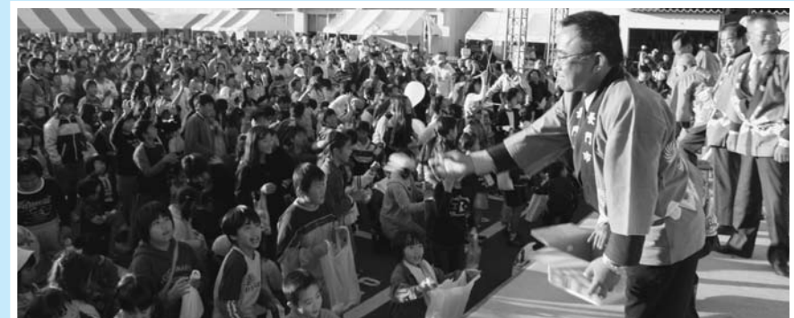
▲「こっちに投げてえ〜!」ふるさとまつり恒例のもちまき