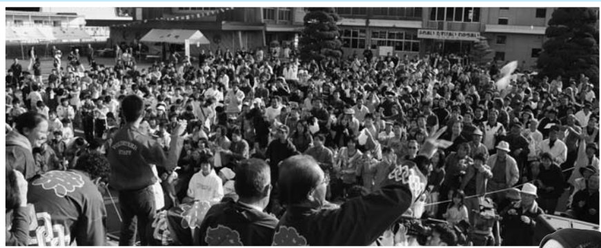
▲ ステージ前で行われたもちまきに集まった人！人！！人!!!