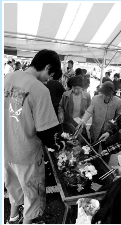
▲ 行列のできた油谷但馬牛試食会