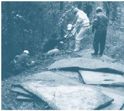
【三隅地区の不法投棄現場での回収作業】

「長門市をきれいで美しいまちにしたい」という願いを込めてつくられたのが「長門市ポイ捨て等防止条例」ですが、残念なことに山林・農地・遊休地・道路・水路など市内各地の様々な場所でも、ポイ捨てや不法投棄が行われています。 このままでは、長門市の美しい景観も台無しになってしまいます。ポイ捨てや不法投棄をくい止め、美しい長門市を私たちの手で大切に守っていくことが大事ではないでしょうか。 不法投棄は犯罪です。違反をした人に対しては5年以下の懲役または1千万円以下の罰金が科せられます。不法投棄の現場