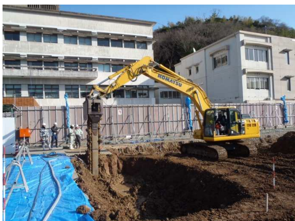
地盤改良山留め壁施工