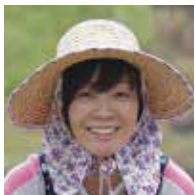
安倍昭恵 (あべ・あきえ)

アグリアート・フェスティバル名誉理事長。内閣総理大臣安倍晋三夫人。聖心女子学院幼稚園から高等学校卒業。聖心女子専門学校英語科卒業。立教大学大学院 21世紀社会デザイン研究科修了。株式会社電通新聞局を経て1987年安倍晋三氏と結婚。趣味は、ランニング、ゴルフ、お米づくり、薙刀。