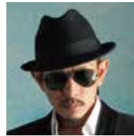
DOZAN11 (どうさんいれぶん) 《友情出演》

アジア全域で人気を誇るアジアを代表するファッションモデル。2014年のAAFでもゲストモデルとしてランウェイを歩き、今年で2回目の出演となる。中国で売り上げNo.1のファッション雑誌でも企画が好況となり、連続起用されている。TVや映画、CMなど幅広い分野にて大活躍中。