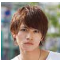
藤田富 (ふじた・とむ)

レゲエ歌手。「三木道三」として「Japan 一番」でデビュー。「Lifetime Respect」でジャパニーズレゲエ初のオリコン1位を獲得し、90万枚以上を売り上げた。2014年11月新たな名義「DOZAN11」でニューアルバム「Japan be Irie!!」をリリース。レゲエ系を主に各地のフェス、イベントに次々出演中。