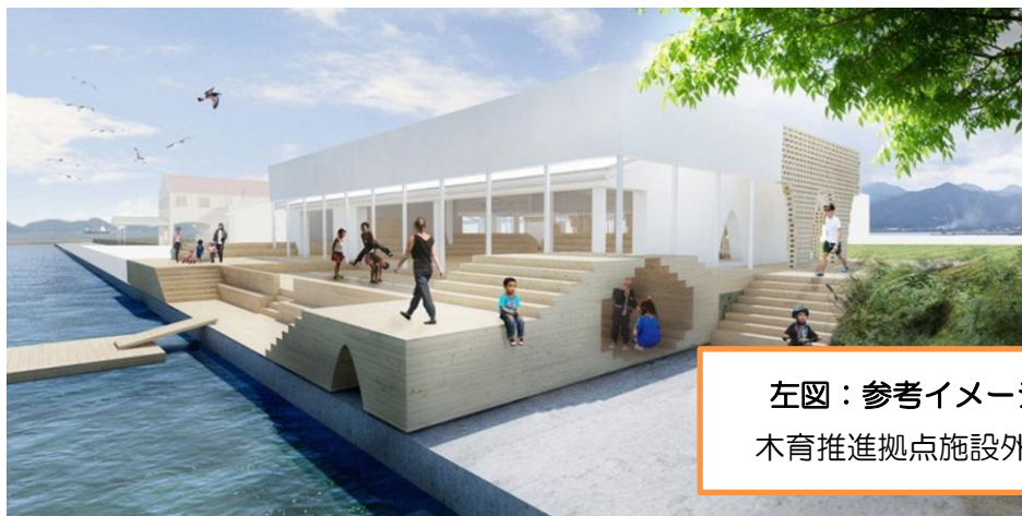
左図:参考イメージ 木育推進拠点施設外観