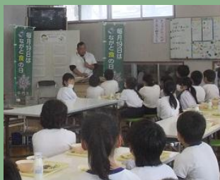
↑ 給食で古代米の説明