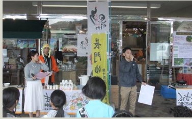
↑ 椎の実を拾って集合！イベント