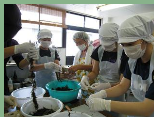
↑ アカモクの加工研修