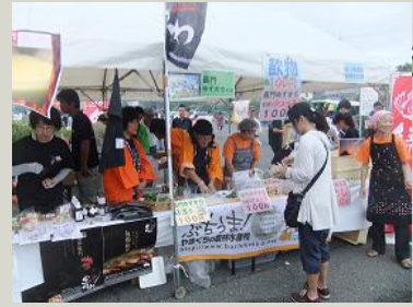
↑ 西日本やきとり祭り