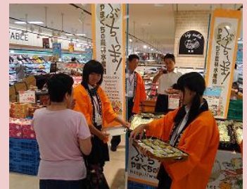
↑ 市外で白オクラの販促

○生産者、流通・加工関係者、消費者が協働した「地産・地消」を通じて長門地域産の農林水産物の需要拡大を目指しています！