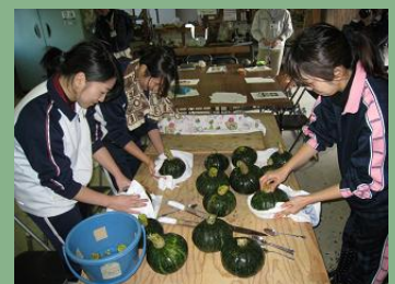
↑ 冬至かぼちゃの出荷研修