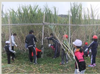
↑ 向津具小学校でサトウキビ学習