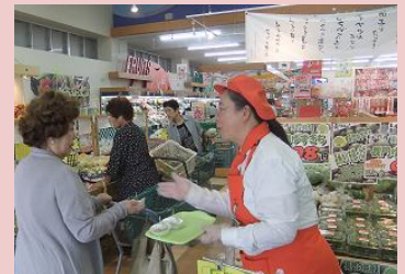
↑ 市内の販売協力店で販促