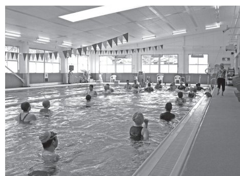
▲専門のスタッフと一緒に楽しく運動