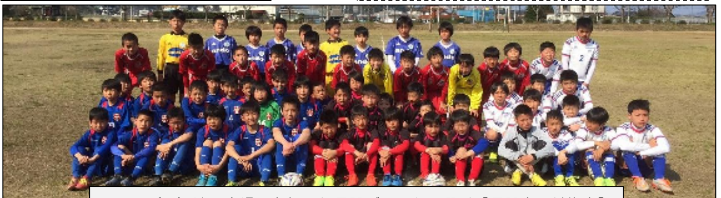
19日(日)油谷会場に参加した長門ブロックの選手【長門市 美祢市】