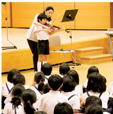
▲プロの演奏家の指導で楽器の演奏体験

大阪交響楽団は9月27日(火)に総勢63人で再びラポールゆやを訪れ、菱海中学校吹奏楽部と共演する予定です。