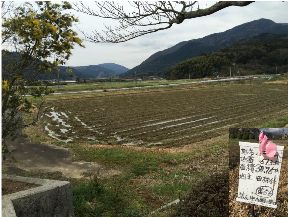
田んぼアート希望地（香月美術館裏）