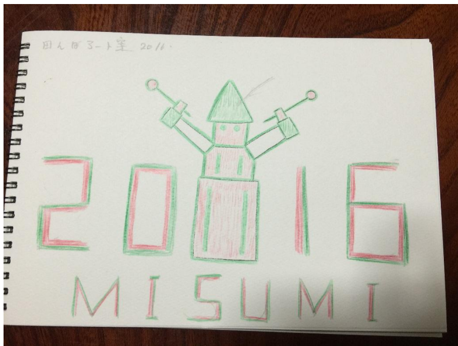
田んぼアートイメージ図

文字、絵赤部分 赤米 文字、絵アウトライン 緑米 絵緑部分 黒米 その他範囲 飼料米