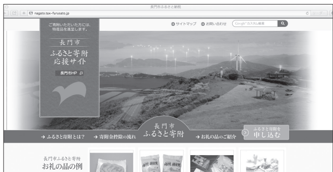
▲長門市ふるさと寄附応援サイト (http://nagato.tax-furusato.jp)

企画政策課企画調整係 (ふるさと応援寄附担当) TEL 23・1116、1229 MAIL chousei@city.nagato.lg.jp ※書類の配布も行います ※受付日時 月曜日から金曜日 8:30~17:15